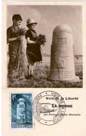
Fontainebleau (Seine et Marne),